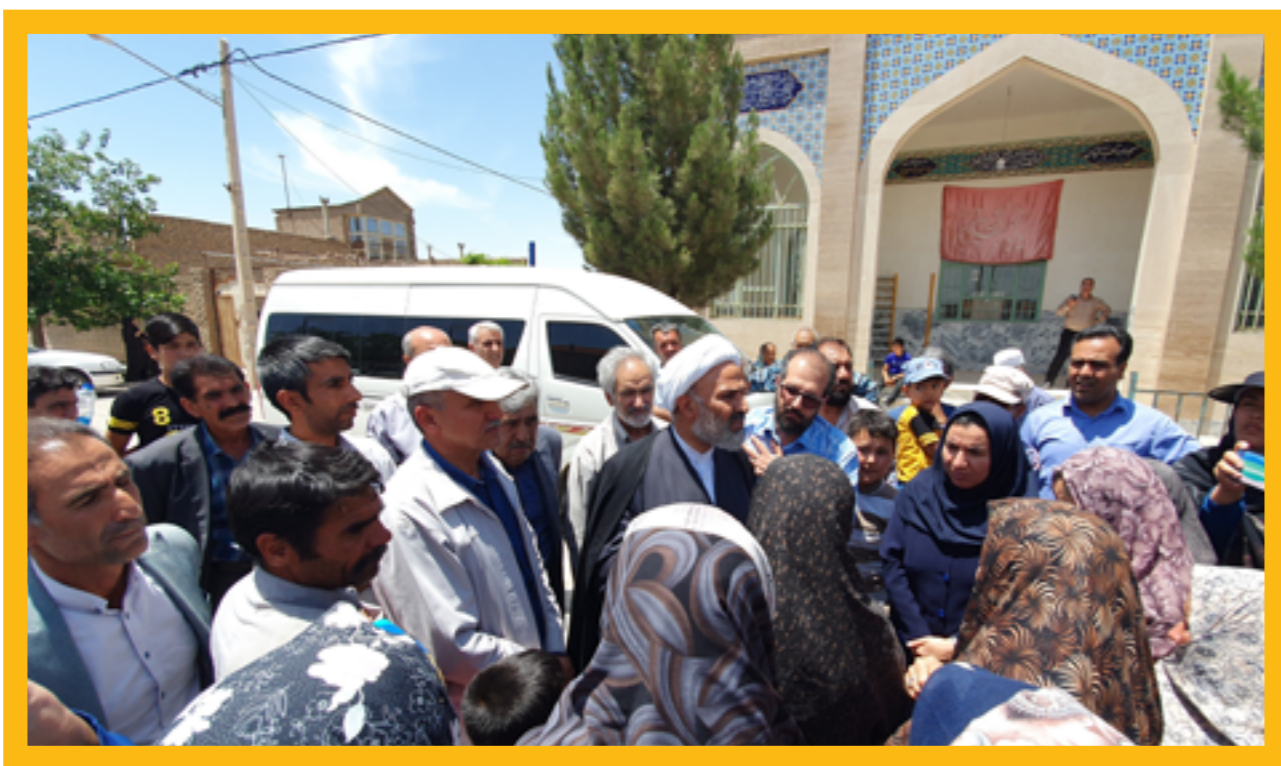
اعتراض روستاییان (درنگ‌آباد) نسبت به وضعیت آب شرب. با دستور حجت‌الاسلام پژمان فر ظرف ده روز مشکل آب شرب روستا مرتفع گردید. بهار ۱۴۰۲