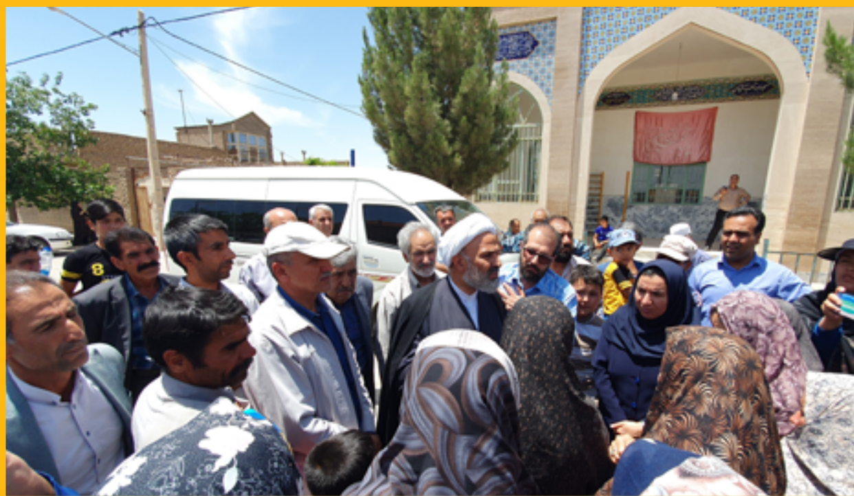
اعتراض روستاییان (درنگ آباد) نسبت به وضعیت آب شرب. با دستور حجت‌الاسلام پژمان فر ظرف ده روز مشکل آب شرب روستا مرتفع گردید. بهار ۱۴۰۲