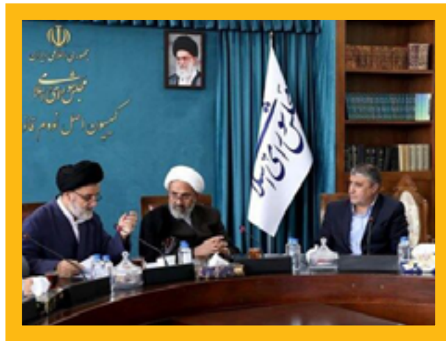
بررسی قانون اقدام راهبردی برای لغو تحریم‌ها در کمیسیون اصل نود

برخلاف ادعای دروغی که بارها مطرح شده، مجلس یازدهم نه تنها در مسیر احیای برجام سنگ اندازی نکرد، بلکه با قانون اقدام راهبردی برای لغو تحریم‌ها، ابزار چانه‌زنی کافی به تیم مذاکره‌کننده را برای لغو تحریم‌ها ارائه کرد. اولاً همان‌طور که رهبر معظم انقلاب نیز تصریح کردند، کشور را از «سرگردانی» نجات داد، ثانیاً هدف آن بهره‌مندی اقتصادی همه مردم از توافق احتمالی هسته‌ای بود. ثالثاً با پایان دادن به اجرای یک طرفه و بیهوده برجام توسط ایران پس از خروج آمریکا از این توافق، عملاً تولید قدرت کرد و دست تیم مذاکره‌کننده ایران برای احیای برجام پر شد.