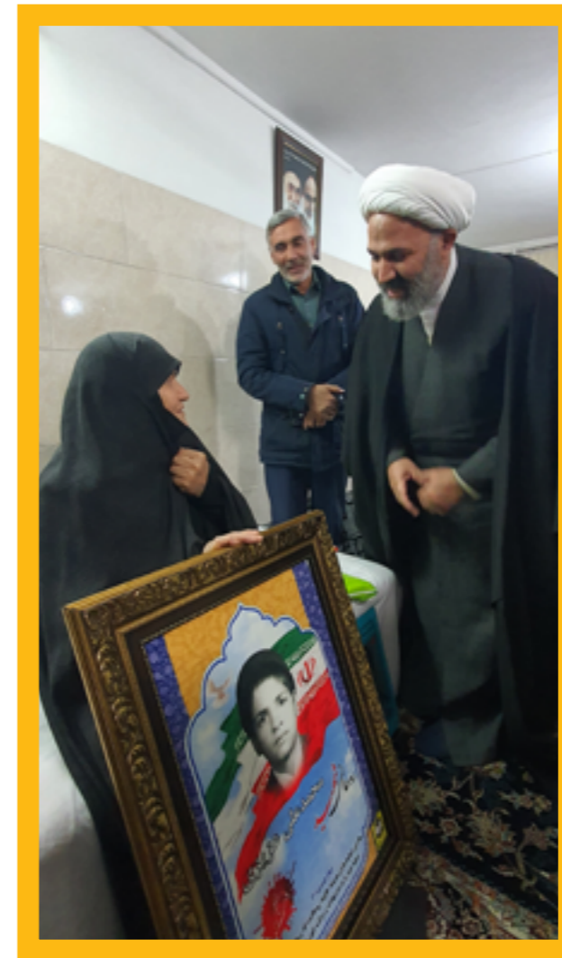
دیدار هفتگی حجت‌الاسلام پژمان فر از خانواده شهدا و ایثارگران