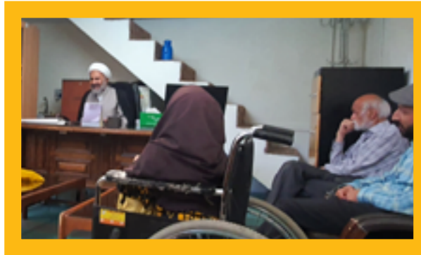
نشست جامعه معلولان با حجت‌الاسلام پژمان فر (بهار ۱۴۰۲)

با پیگیری حجت‌الاسلام پژمان فر در راستای اجرای کامل قانون حمایت معلولان، در خصوص تأمین مسکن افراد دارای معلولیت، علاوه بر پیش‌بینی مسکن موردنیاز برای افراد دارای معلولیت در طرح نهضت ملی مسکن دولت سیزدهم مقرر شد تا با همکاری وزارتخانه‌های تعاون، کار و رفاه اجتماعی، راه و شهرسازی، سازمان برنامه و بودجه و همچنین نهادهای عمومی و انقلابی تا پایان دولت سیزدهم و اختصاص تسهیلات و اعتبارات لازم برای تأمین ۷ هزار واحد مسکونی ویژه خانواده‌های دارای حداقل سه عضو معلول فراهم شود.