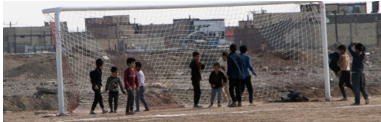
● بهره‌برداری از نخستین زمین فوتبال در روستاگرگی در حاشیه شهر مشهد با حضور حجت‌الاسلام پژمان فر زمستان ۱۴۰۰

مناطق محروم در بودجه سنواتی نیز همیشه مورد توجه مجلس بوده و اقدامات بزرگی برای این مناطق در بودجه‌های سالانه انجام شده است؛ از جمله تخصیص ۳ درصد از صادرات نفت خام و گاز به مناطق کم‌توسعه یافته، تخصیص قیر رایگان برای توسعه مناطق محروم و روستاها، اختصاص تا ۴۰ درصد