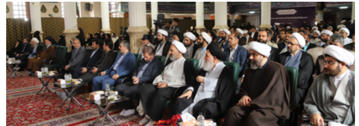
پاسداشت چهل هفته ملاقات مردمی حجت‌الاسلام پژمان فر با حضور نماینده ولی فقیه در خراسان رضوی (اسفند ۱۴۰۱)