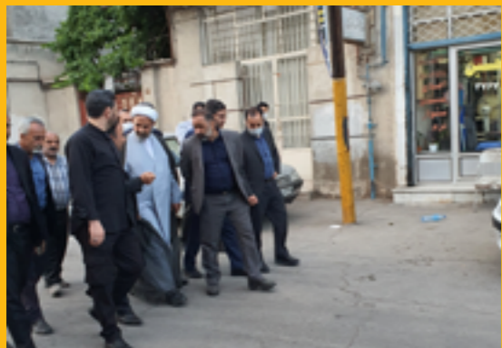
بازدید میدانی حجت‌الاسلام پژمان فر از محله آبکوه تابستان ۱۴۰۲

اگرچه در میانه شهر واقع شده و در محاصره مناطق برخوردار است؛ اما محله آبکوه مشهد همچنان در زمره بافت‌های فرسوده و پرچالش شهری محسوب می‌شود؛ جایی که تلاقی کاستی‌های زیرساخت شهری و بزهکاری‌های اجتماعی، عرصه را برای زندگی مردم تنگ می‌کند.