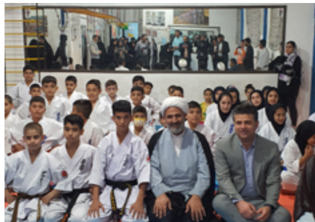
تجهیز باشگاه ورزشی در بولوار توس با حمایت حجت‌الاسلام پژمان فر - تابستان ۱۴۰۲

اگرچه از همان سال ۱۳۹۲ و به دنبال نخستین حضور حجت‌الاسلام والمسلمین پژمان فر در مجلس شورای اسلامی دیدارهای مردمی، هر جمعه از ساعت ۰۶:۳۰ صبح تا پاسی از شب در دفتر ارتباطات مردمی حوزه انتخابیه به صورت ثابت برگزار شده بود؛ اما بنا بر ضرورت شنیدن صدای مردم، حل مسائل محلی، حل مسائل کلان شهری، تقدیر از فعالان فرهنگی و اجتماعی و حضور میدانی در کنار مردم، شکل امروزی این جلسات با محوریت مساجد محلات از سال ۱۴۰۰ آغاز و تاکنون (دیماه ۱۴۰۲) در قالب حضور در بیش از ۷۰ مسجد ادامه یافته است.